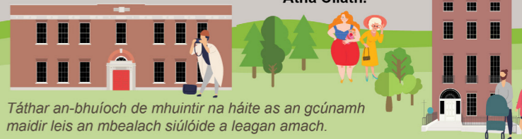
Táthar an-bhuíoch de mhuintir na háite as an gcúnamh maidir leis an mbealach siúlóide a leagan amach.

An mian leat tuilleadh eolais a fháil faoi Limistéir Chaomhantais Ailtireachta sa chathair? Déan teagmháil le hOifig Chaomhantais Chomhairle Cathrach Bhaile Átha Cliath.