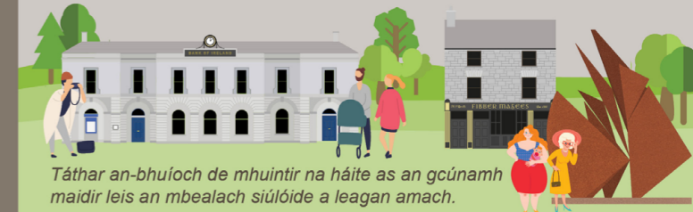
Táthar an-bhuíoch de mhuintir na háite as an gcúnamh maidir leis an mbealach siúlóide a leagan amach.

Ar mhaith leat níos mó a fhoghlaim faoi Limistéar Caomhantais Ailtireachta na Faiche Móire agus faoi Limistéir Chaomhantais Ailtireachta eile sa chathair? Déan teagmháil le hOifigeach Caomhantais Ailtireachta Chomhairle Cathrach na Gaillimhe.